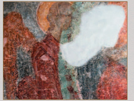
Angel from the mural painting in the chapel