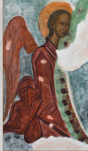
Предполагаме стенопис от олтара на църквата. Акварелно копие, 1930 г. Художник: Милен Сакъзов